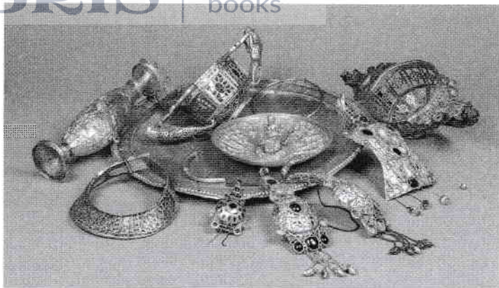
Tezaurul de la Pietroasa, județul Buzău, mijlocul secolului al V-lea, Muzeul Național de Istorie a României

Iustinian continuă politica lui Constantin cel Mare, anexând vaste regiuni din Câmpia Română. Locul gepizilor în Pannonia și în vecinătate este luat de avari, victorioși pe câmpul de luptă (împreună cu longobarzii) în 567. Avarii s-au limitat, în general, la un control formal asupra Transilvaniei. Enclavele lor au fost asimilate ulterior (secolele al VII-lea–al VIII-lea) și topite în masa localnicilor.